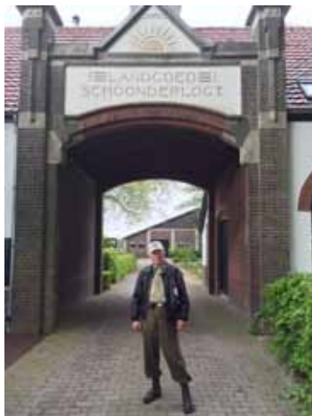
• Voormalig HQ Schoonderlogt