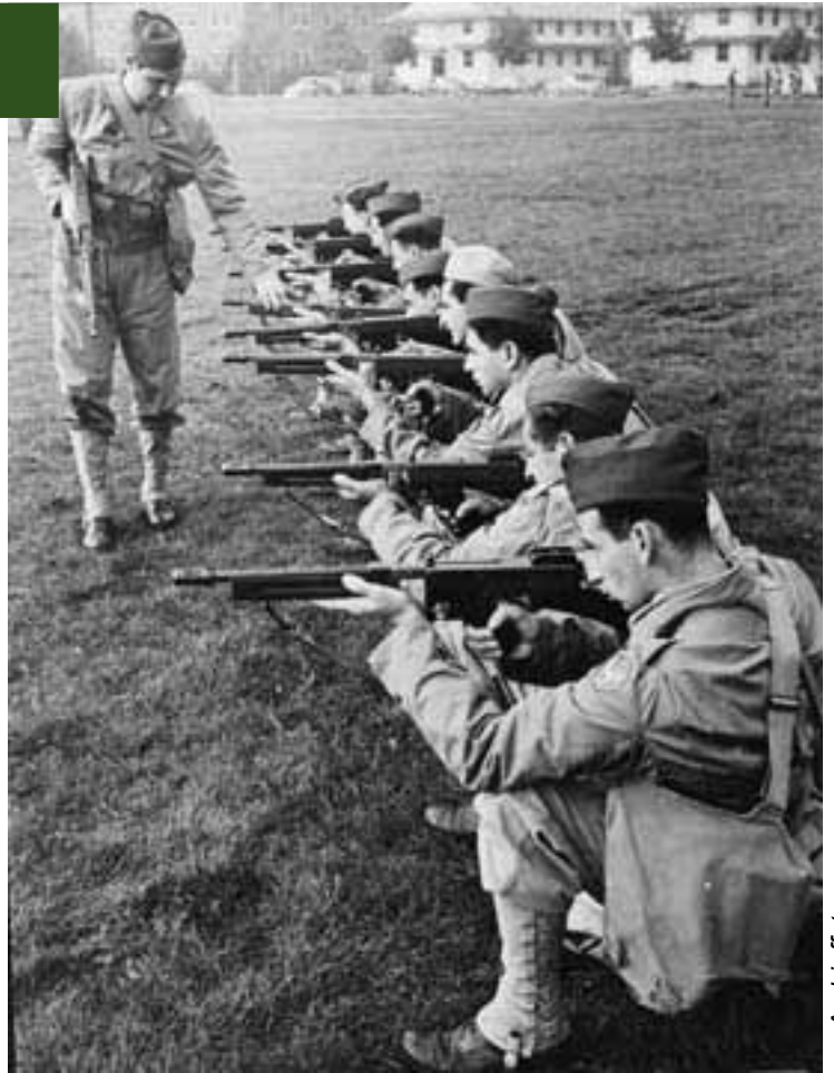
• Archief foto