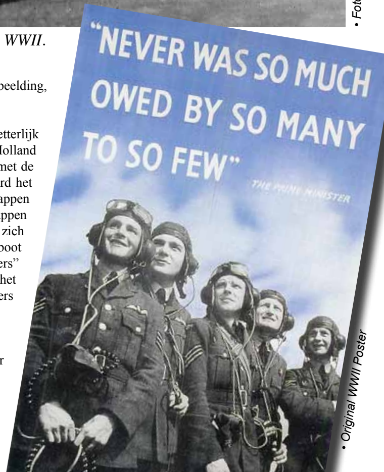
• Original WWII Poster

Rond die tijd begon de Luftwaffe aan kracht te verliezen welke Hitler probeerde te compenseren met de zgn. VergeltungsWaffen. De V-1 vliegende bom was daar het eerste voorbeeld van. Een onbemand raket vliegtuigje wat met primitieve richtmiddelen dat vanaf lanceerbanen over het Engelse Kanaal richting Londen werd geschoten. Deze V-1's waren relatief traag en slecht te richten maar in een groot bewoond