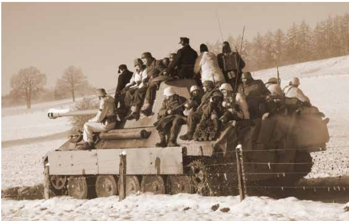
• De Tiger tank die de vijand kort hierna zou verliezen door toedoen van de SAS.