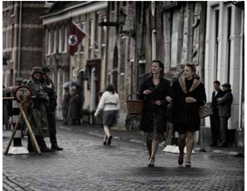
• Straatbeeld Brielle '40-'45