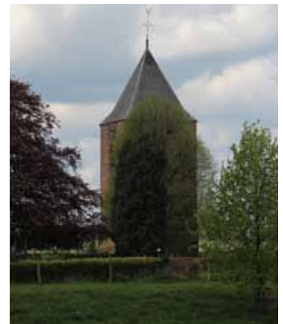
• De bekende 'Gen. Taylor' toren