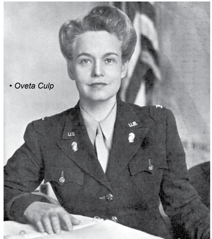
• Oveta Culp

of KPRC radio and television broadcasting in Houston, served as a consultant to the Hoover Commission investigating governmental efficiency, and became active in national Republican politics, helping elect Dwight D. Eisenhower to the presidency and in January 1953 was named director of the Federal Security Administration (FSA). In March the FSA was elevated to Cabinet status as the Department of Health, Education, and Welfare, and Hobby, as the first secretary of HEW, became in April the second woman to hold a U.S. Cabinet position. She retained the post until resigning in July 1955. In that year she became president and editor of the Post; she became chairman of the board of the Post in 1965 and remained in that position until the paper was sold in 1983 to the Toronto Sun Publishing Company. She was a director of the Corporation for Public Broadcasting from 1968 and of a number of other corporations.