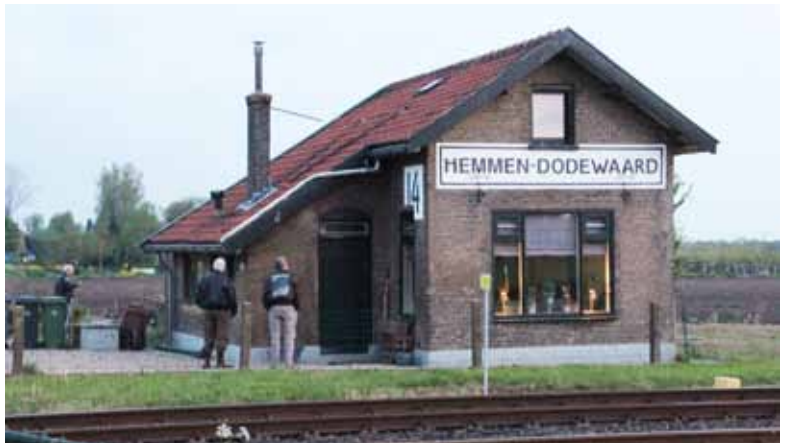
• Bekende plek

landers. Wij zijn hen dankbaar dat hij voor onze vrijheid heeft gevochten en dat is niet in geld uit te drukken.