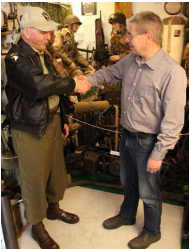
• Betuws Oorlogsmuseum Heteren

Tekst Johan van Waart johan@band-of-brothers.nl