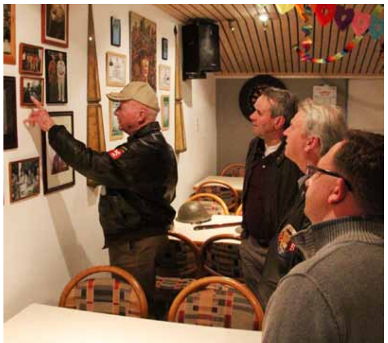
• Clubhuis "Screaming Ducks"