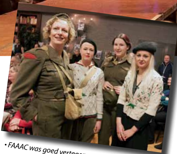
• FAAAC was goed vertegenwoordigd!

Op zaterdag 11 april gebeurde er verschillende dingen: