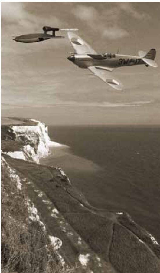
• Tipping over! De jacht op de V-1 bommen boven de White Cliffs of Dover.

gebied als Londen werd toch nog veel schade aangericht en kwamen veel burgers om het leven. De Spitfires van 322 SQ kregen de taak deze V-1's af te schieten voordat ze Londen konden bereiken. In het begin werden ze met boordwapens bestookt tot ze ontploften wat niet altijd zonder gevaar was. Na verloop van tijd kwam men erachter dat als men ernaast ging vliegen en met de vleugeltip van de Spitfire de vleugel van de V-1 oplichtte deze uit koers raakte en acuut neer storte. 322SQ kreeg 108 geclaimde V-1's toegewezen.