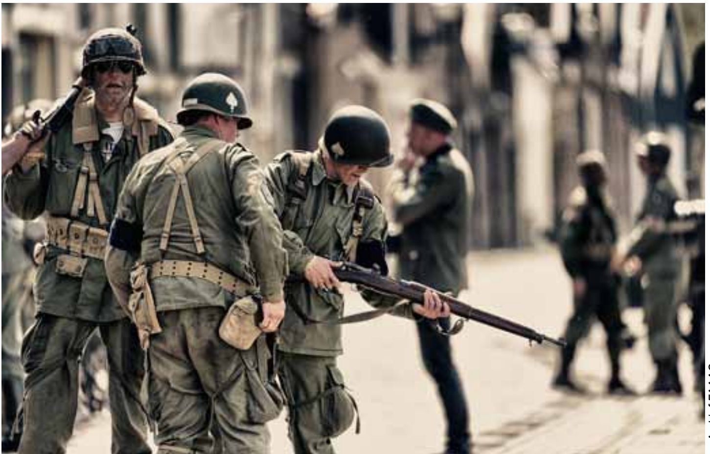
• Archief FAAAC