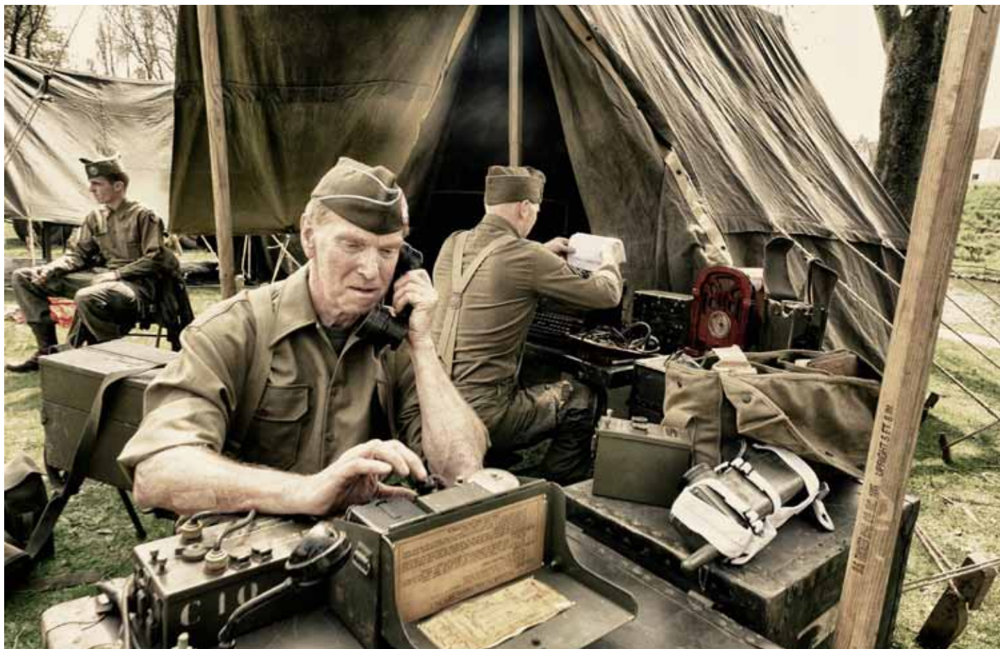
• Communicatie, en gebruik van Call Signs, op het Basecamp in Veghel gedurende de herdenkingen van Operation Market Garden in 2014.