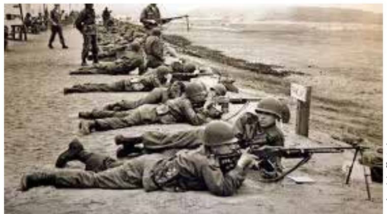
• Training voor de WO2 wapens; M1919A4 Light Machine Gun, (foto links) en M1918A2 Browning Automatic Rifle, (foto rechts). Alle categorie II wapens!