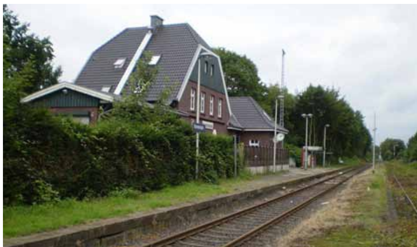
• Station Hamminkeln

Uiteindelijk zijn ze samen met de restanten van de 6th Airborne, onder het divisional motto "Go To It", Duitsland verder ingetrokken. Na de oversteek over de rivier Weser, richting Minden, Celle, Dover de Elbe waar ze uiteindelijk de Russen hebben ontmoet in Wismar op 2 mei 1945 •