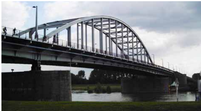
• De brug over de Rijn.

Officieel viel de 52nd onder de 1st Airlanding Brigade van het 1st British Airborne Divisie en waren onderdeel van het Divisional Defence Platoon. Dit