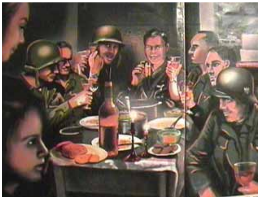
• This illustration shows the German soldiers around he Christmas table.

A: Many years have gone since that bloodiest of all wars, but the memories of that night in the Ardennes never left me. The inner strength of a single woman, who, by her wits and intuition, prevented potential bloodshed, taught me the practical meaning of the words: "Good will Toward Mankind." Now and then, on a clear tropical winter night, I look at the skies for bright Sirius and •