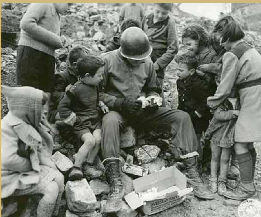
• Archief Foto