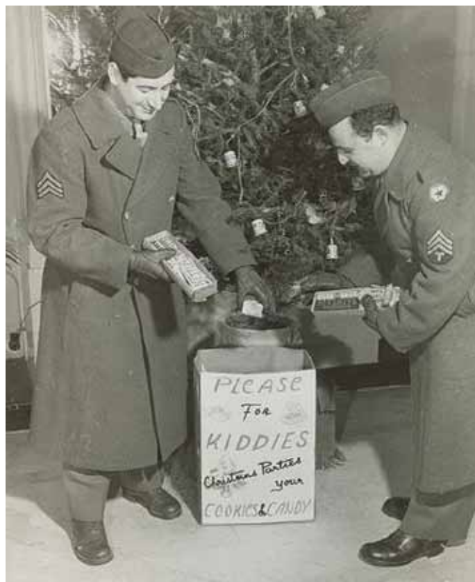
• Archief Foto