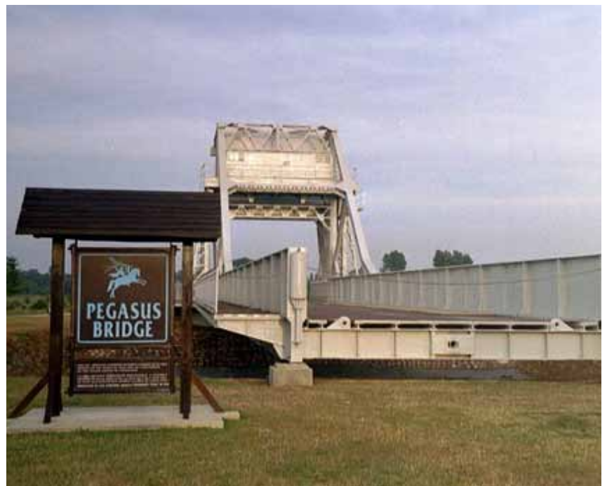
• Pegasus Bridge

Rond middernacht op de nacht van 5-6 juni '44 begonnen zes Horsa Gliders aan hun landing in Normandië. (Vervolg op pagina 5)