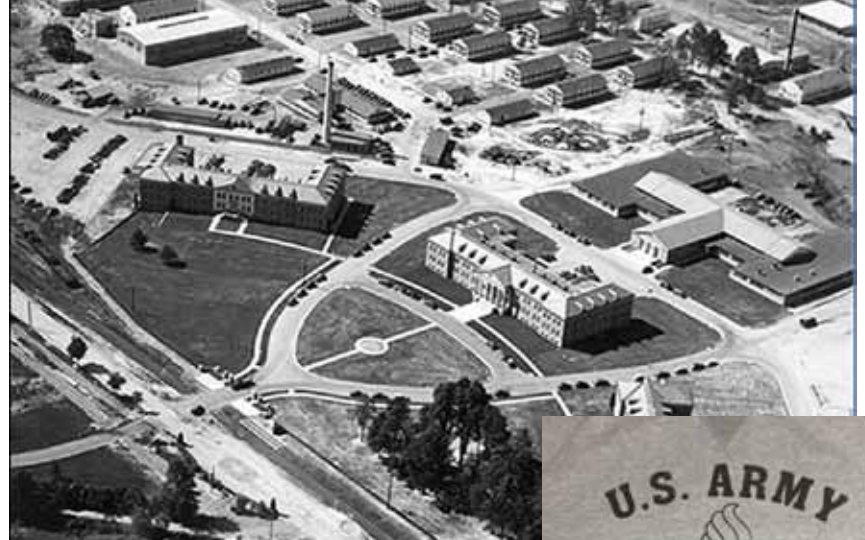
• Archief Foto

Tegen 1940 alle Ordnance Corps opleidingen, officier en soldaat werden verplaatst van Raritan Arsenal, New Jersey naar de Aberdeen Proving Ground, voor de vorming van de Ordnance School.